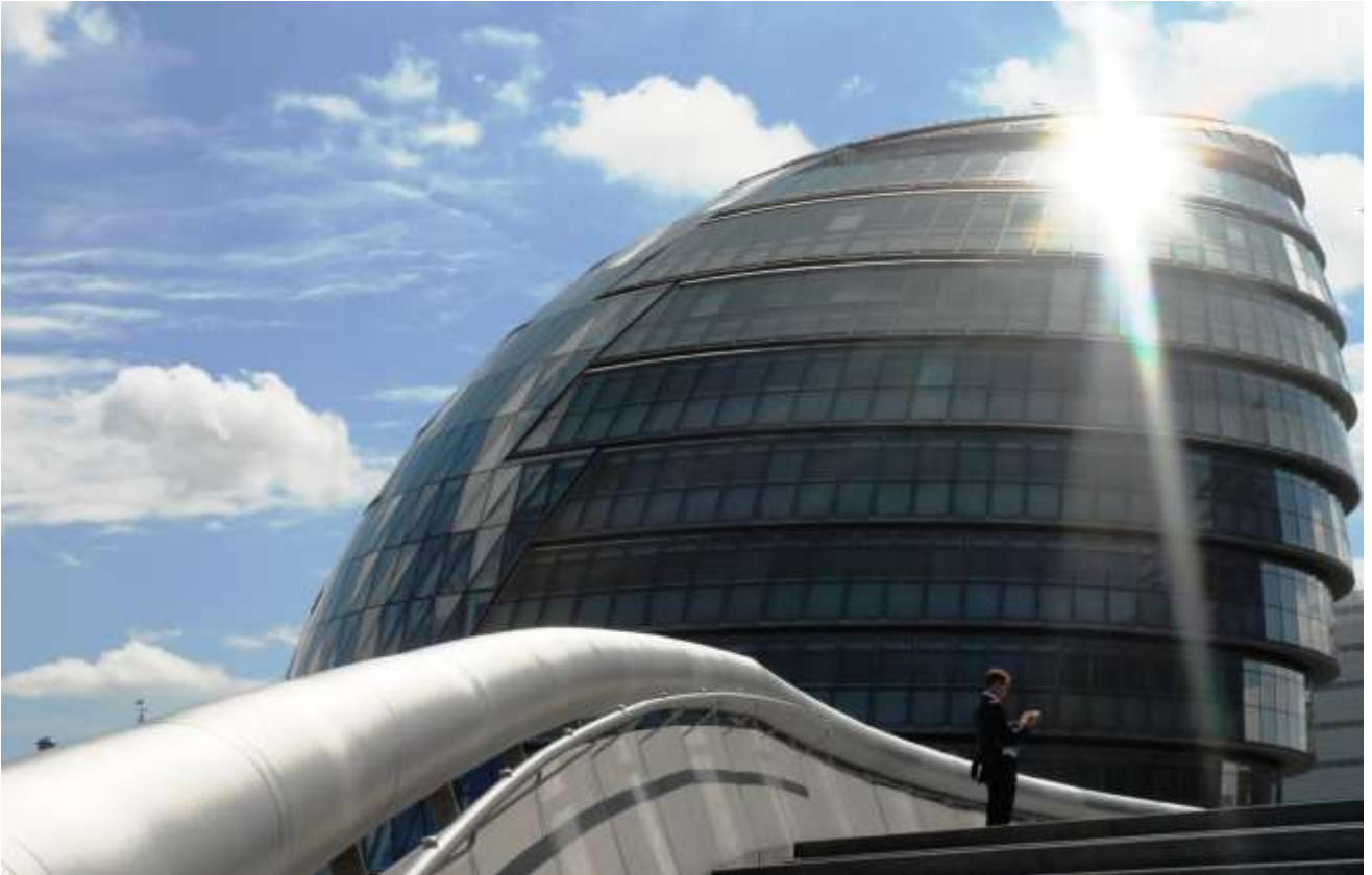
Manager rampanti invadono questi luoghi... Ma vicino, nell'arena, si esibiscono gruppi etnici ...