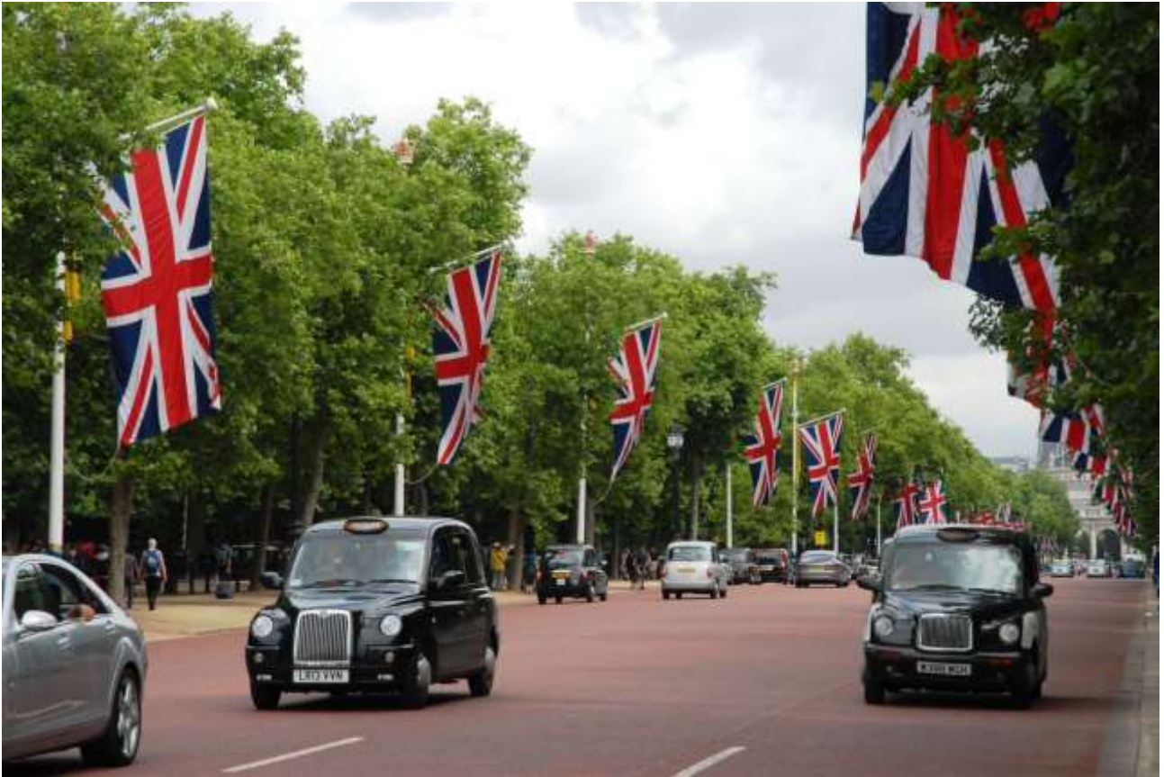
The Mall, in fondo il gigantesco cancello che si apre su Trafalgar square.