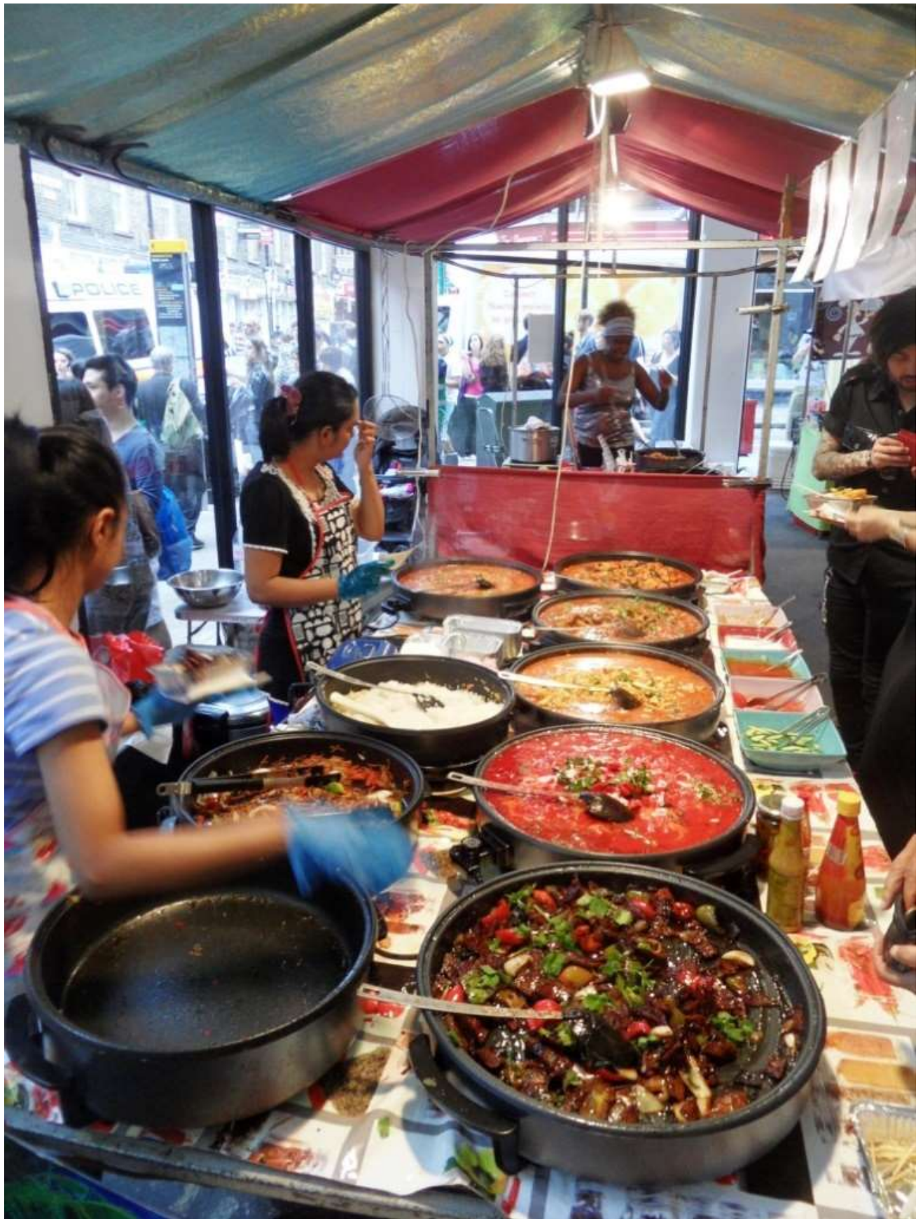
Sapori intensi nei pressi della stazione di London Liverpool Street.